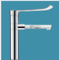
Torneiras para Estabelecimentos Hospitalares e de Cuidados de Saúde