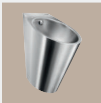
Sanitários em Aço Inoxidável