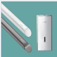
Acessibilidade e Autonomia Acessórios de Higiene