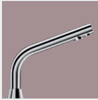
Torneiras para Locais Públicos